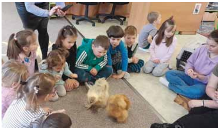
Velice zajímavá a nevšední návštěva v mateřské školce, pracovníci farmaparku přinesli králíčky a slepičky.

Největší radost dětem přinesla chvíle s přímým kontaktem se zvířátky. Učily se, jak k nim přistupovat klidně a jemně, aby se jich zvířátka nebála. Králíci i slepičky byli trpěliví a děti si kontakt s nimi bohatě užily. Setkání bylo zábavné i vzdělávací. Děti si odnesly nové znalosti, zkušenosti a krásné vzpomínky. Takové chvíle pomáhají budovat pozitivní vztah k přírodě a učí děti vnímat svět kolem sebe všemi smysly. Program byl realizován v rámci projektu OP JAK.