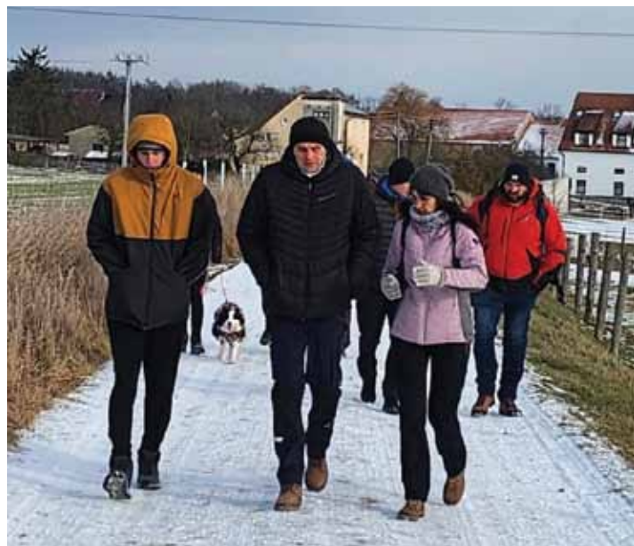
Pochodem na „Křížák“ začal další rok

Věříme, že si všichni pohyb na čerstvém vzduchu užili a že se setkáme na Křížovém vrchu i příští rok.