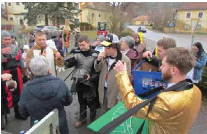
Dům od domu, všude něco ochutnat, to je hodně náročný masopustní průvod.