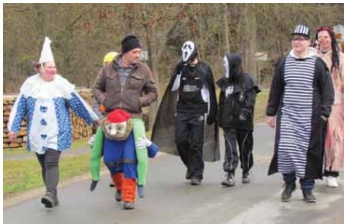
Černotínem prošly masky, všude se zastavily, pojedly, popily.