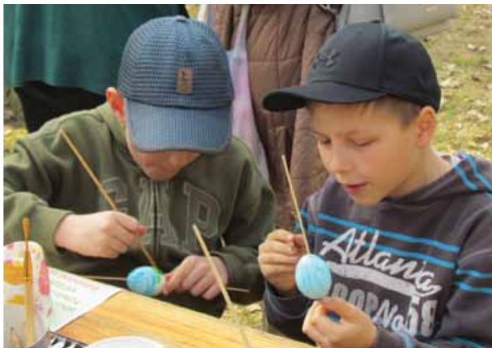
Pěkně vymalovat kraslice, to už dá pěknou „fušku“.

Atmosféra byla příjemná a pohodová a společně jsme si s předstihem připravili radostné Velikonoce.